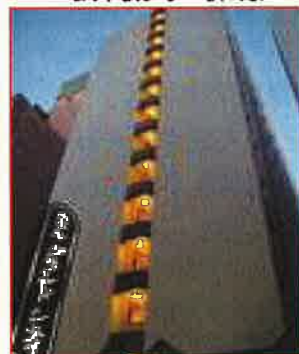
ホテルグランドシティ池袋