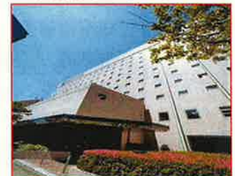
チサンホテル浜松町