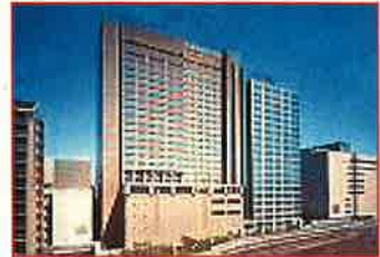
東武ホテルレバント東京